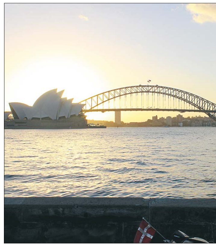
Efter godt 10.000 kilometer nåede jeg mit endelige mål.