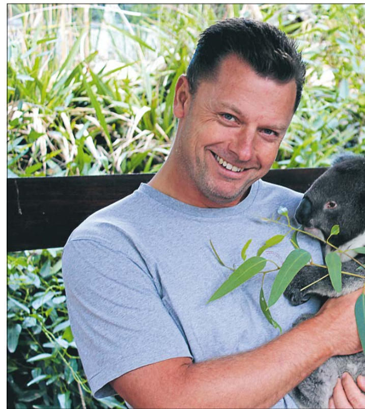
Der var også tid til at lege turist. Her i Adelaide med en af de lokale.