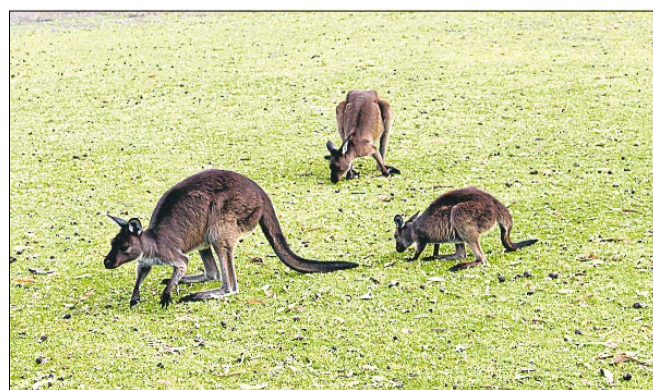
Kænguruer så jeg i hundredvis, men sjældent en hel familie som her.