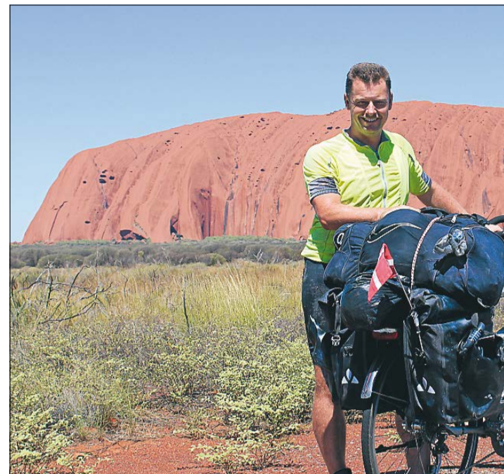
At ankomme på cykel til en af verdens største seværdigheder var en helt fantastisk oplevelse.

Den tanke gør, at jeg tager de mentale skyklapper af igen. Nu ser jeg ikke længere bare det, som jeg har set de seneste dage, nemlig en uendelig lang, modvindsramt asfaltvej. Jeg får kontakt til mine sanser igen og begynder at nyde den friske luft fra det enorme hav, jeg kører lige ved siden af. Jeg nyder at se emuer, disse strudselignende kæmpefug-