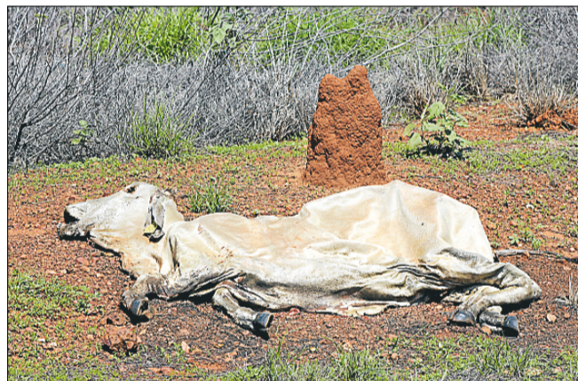
Når 53 meter lastbil og dyr ramler sammen, ender det sjældent kønt. Døde kænguruer, heste og køer så jeg masser af.

I en måneds tid har det at cykle i ødemarken været min hverdag, og jeg tænker derfor egentligt ikke så meget over, at det er noget ikke helt normalt, som jeg er i gang med, men det minder tommeltotterne mig heldigvis om.