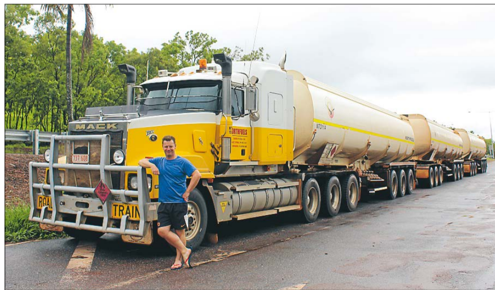
En lastbil i Australien, et roadtrain, kan være rigtig lang - op til 53 meter med op til fire vogne på slæb.

Jeg har hørt, at turen ned ad Stuart Highway skal være en magisk oplevelse. Indtil nu får regnvej og fugt imidlertid magien til at glimre ved sit fravær, og jeg nyder ikke rigtigt cyklingen.