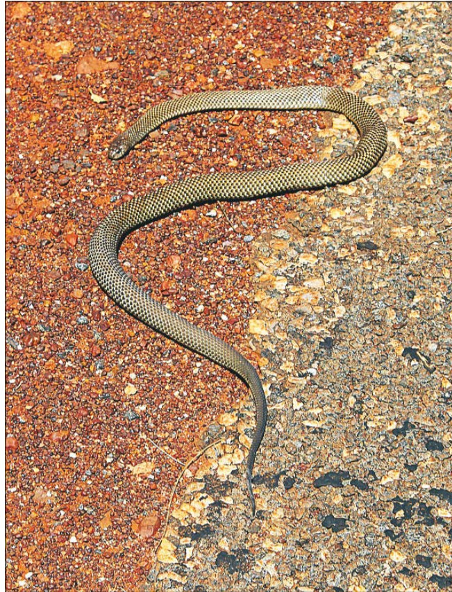
Giftige dyr er der masser i Australien, men de voldte mig ingen problemer. Her en brown snake, en af verdens giftigste slanger.

Jeg forlader Alice Springs, og dagen efter når jeg Erldunda, hvor jeg drejer fra og begynder på de 260 kilometer ud mod Ayers Rock. På min tur ud til den rustrøde kolos får jeg mange anerkendende tommeltotter fra bilisterne, og det motiverer.