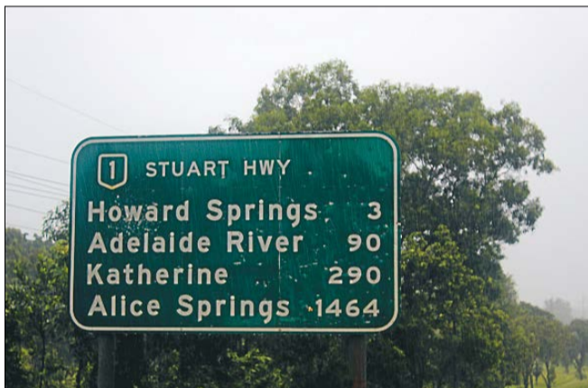
Australien er cirka 170 gange større end Danmark, så det er nogle lidt andre distancer, end vi er vant til herhjemme.