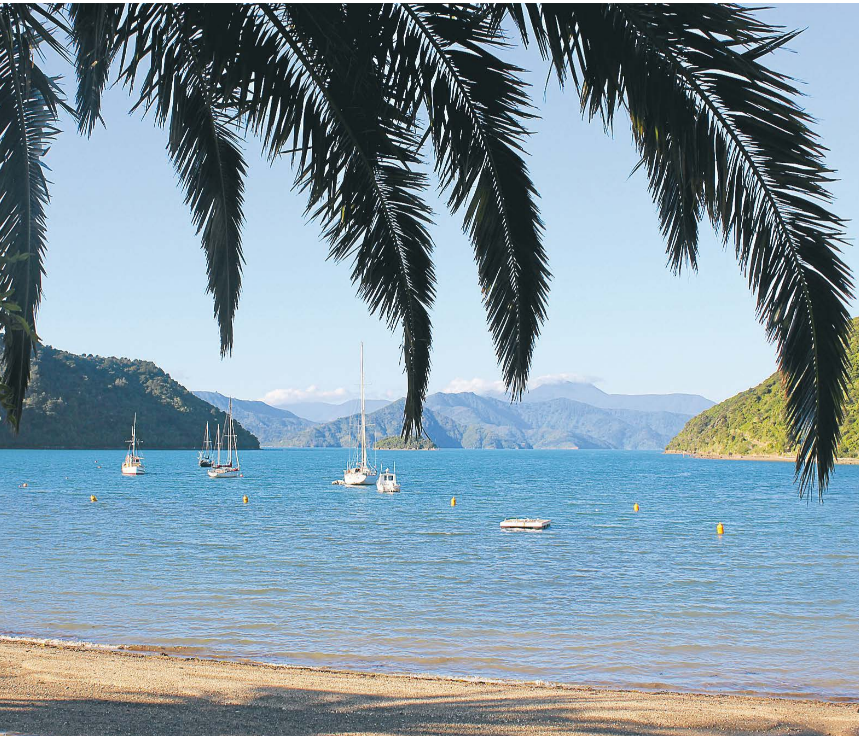
Picton på Sydøen, en lille idyllisk by, hvor jeg lige tog et par dage med Frank-tid = selvalgt ensomhed, hvor jeg kunne bearbejde nogle af de mange indtryk, jeg havde fået på de første fem uger.